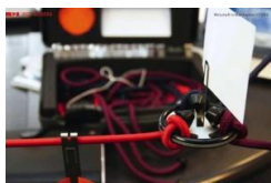
Werkzeug für bessere Zusammenarbeit